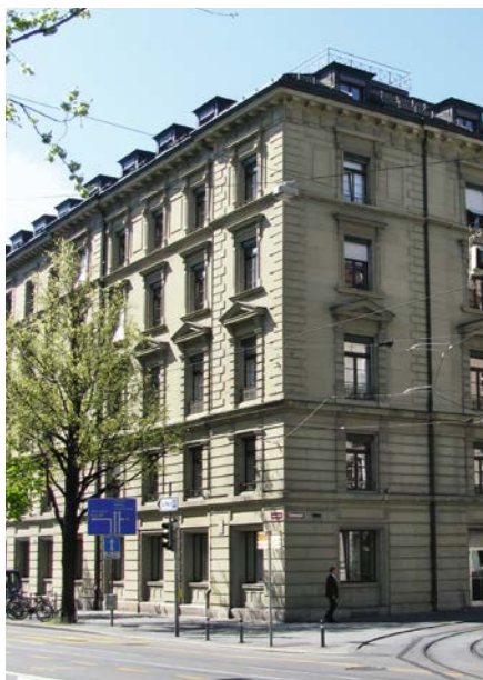
Siège de l'AFC à partir de 1916: Bundesgasse 32.

Depuis 1915, l'Administration fédérale des contributions (AFC) fournit la plus grande part des recettes de l'Etat. Elle est en outre la garante de l'uniformité des impôts en Suisse. La légitimité démocratique et la charge fiscale modérée font que nous possédons, en comparaison internationale, un système fiscal durable et attractif. Cet anniversaire est l'occasion de nous pencher sur l'origine de l'institution.