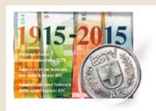
Sujet de l'enveloppe du jour d'émission