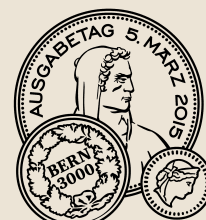
Cachet du jour d'émission