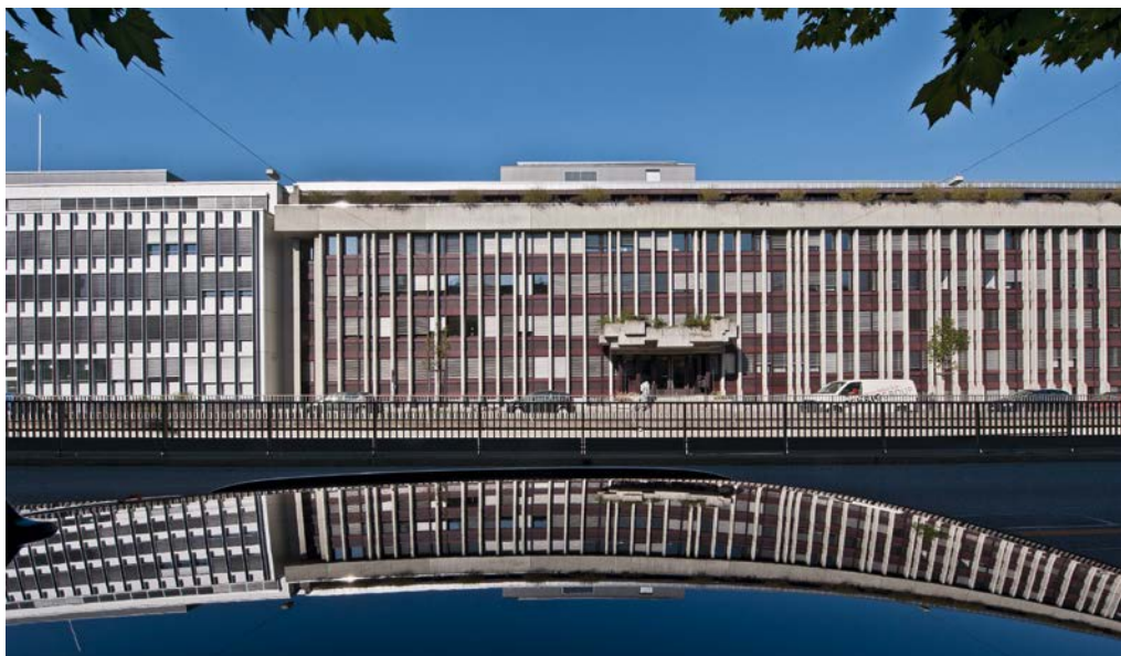
Siège actuel: Eigerstrasse 65.

Fidèle au poste: en 1939, l'économiste Paul Amstutz reprend les rênes de l'AFC. Il restera en place pendant 36 ans, jusqu'à sa retraite en 1952.